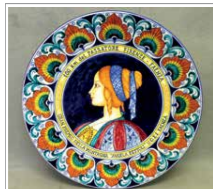
Gran Premio "Angela Bettoli"