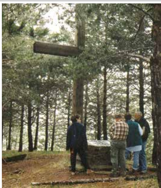
Dalla "Guida escursionistica" anno 2000 la Croce ove sorgeva il Castello

Del castrum Fontanae Monetae , proprietà della Chiesa faentina, abbiamo notizia fin dal 1093 e una bolla papale di Celestino II del 1143 menziona fra le dipendenze della pieve di S. Giovanni in Ottavo una cappella di Fontana Moneta intitolata a S. Andrea. Nel 1291 è registrata come chiesa Sant'Andrea de Fontana Moneta (in pieve di Ottavo). Nel corso del XIII-XIV secolo il castello fu posseduto prima dai Pagani di Susinana poi dai Manfredi fino al 1367 , per essere poi smantellato dalla Santa Sede. Ne rimase qualche traccia sul poggio Castello. Nel 1371 non si menzione più il castello ma solo Fontana Moneta come distretto