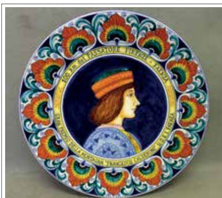
Gran Premio "Checco Calderoni"