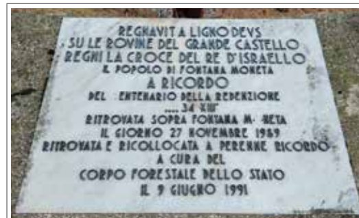
La lapide 1934-1991