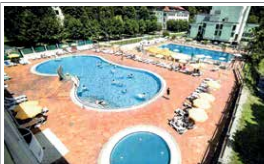
Piscina Hotel Rogaska