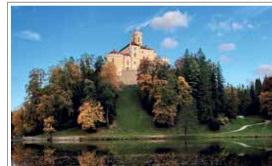
Castello di Trakoscan