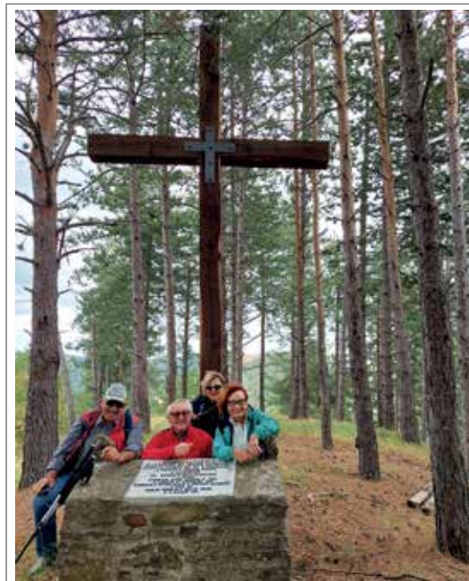
La Croce del 5 aprile 2023