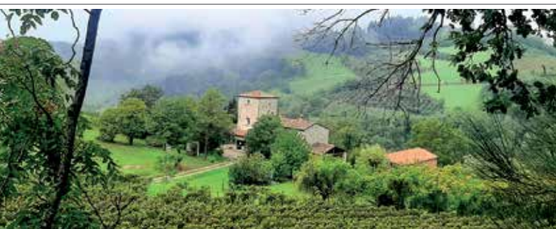
25 settembre 2022 escursione nelle colline di Brisighella.