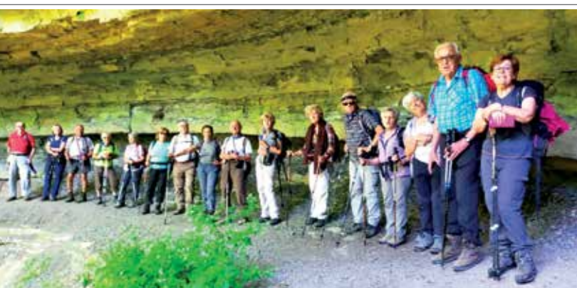
12 giugno 2022 escursione a Prato all'Albero.