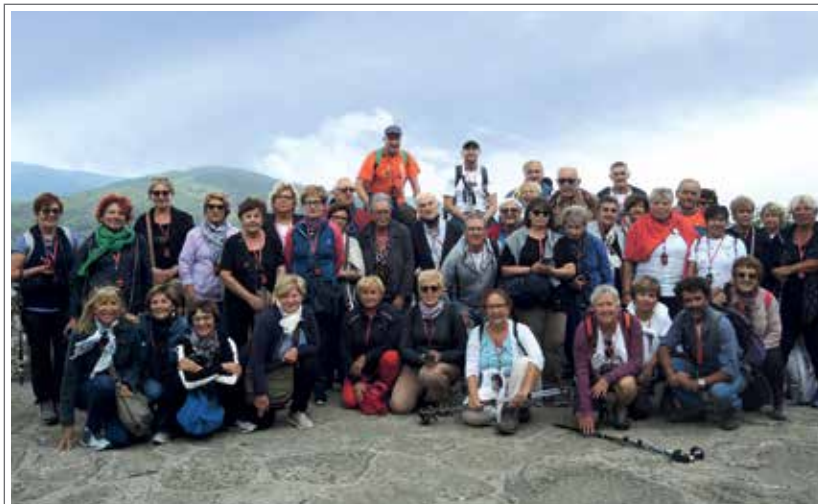
10 settembre 2022 a La Verna.