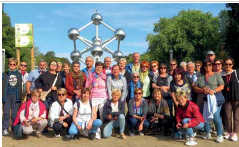
24-29 agosto 2022 nelle Fiandre.