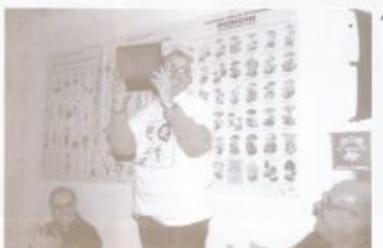
Il Presidente di Pietrasanta con la nostra maglietta mostra la targa ricevuta in occasione del raduno.