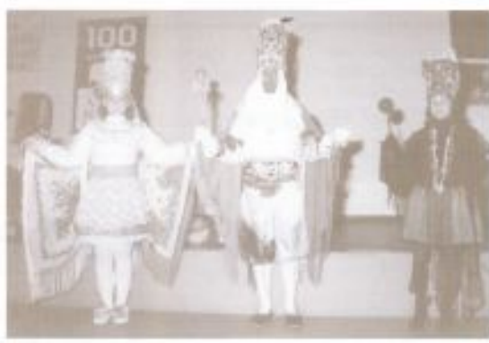
Le maschere di Sappada.