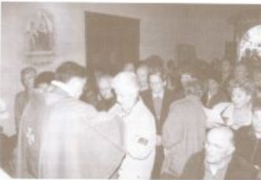
Un momento della cerimonia religiosa.