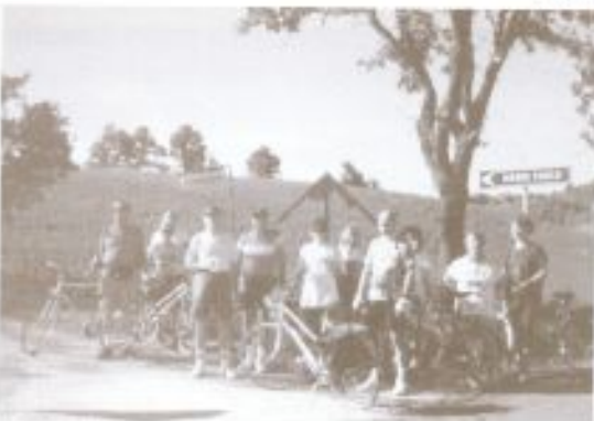
1309/98 - Un gruppo di Uoemini in bio verso M. Paolo.