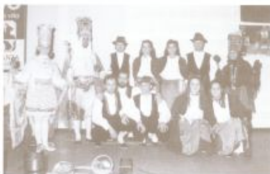
Il gruppo folk del "Legar".