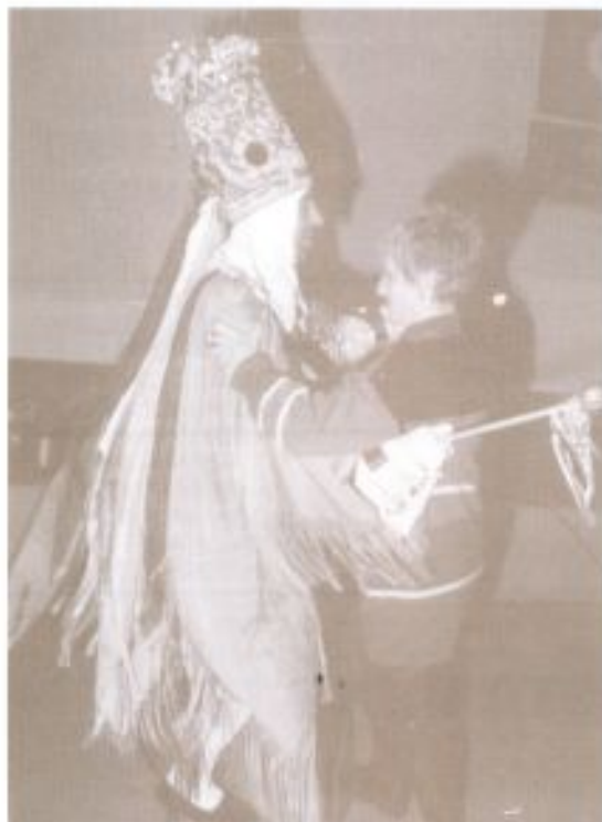
Un ballo con la maschera di Sappada.