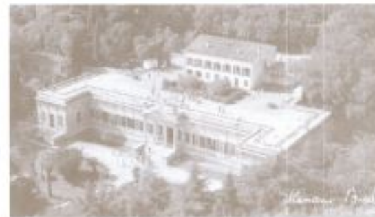
22 settembre 1998 - Saluti da Tuna Paola e un gruppo di uomini dalla Villa di Napoleone (Isola d'Elba).