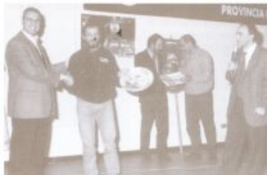
Un piatto di ceramica faentina per Maurilio De Zolt.

Protagonisti il gruppo folk dei "Legar" di Casamagnazzo (BL): un gruppo di giovani che da 15 anni porta avanti con passione la tradizione della Val Comelico e di Sappada. Dopo aver raccolto numerosi consensi nella centrale piazza faentina piena di gente fermatasi ad ascoltare ed applaudire interrompendo il tradizionale "passeggio" del sabato pomeriggio, i ragazzi bellunesi si sono ripetuti alla grande in una serata che è stata anche degna di celebrazione dello straordinario Maurilio De Zolt , il campionissimo dello sci nordico che ha partecipato volentieri a questa parti-