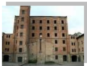
Risiera è stato ristrutturato

2° giorno – Dopo la prima colazione , rientro in Italia e sosta per la visita guidata alla GROTTA DEL GIGANTE . Si entra da un'apertura naturale, numerosi gradini permettono di raggiungere il fondo al termine di una ripida e suggestiva galleria. A circa 80 metri di profondità si apre la parte più imponente: la Grande Caverna . Si tratta di un unico vano naturale, reso spettacolare dalle dimensioni eccezionali: 98,50 metri di altezza, 167,60 di lunghezza e 76,30 di larghezza . Le principali attrattive della Grande Caverna sono le stalagmiti, le stalattiti e le colate calcifiche, formate dal carbonato di calcio depositato dalle gocce d'acqua piovana che si infiltrano dalla volta.