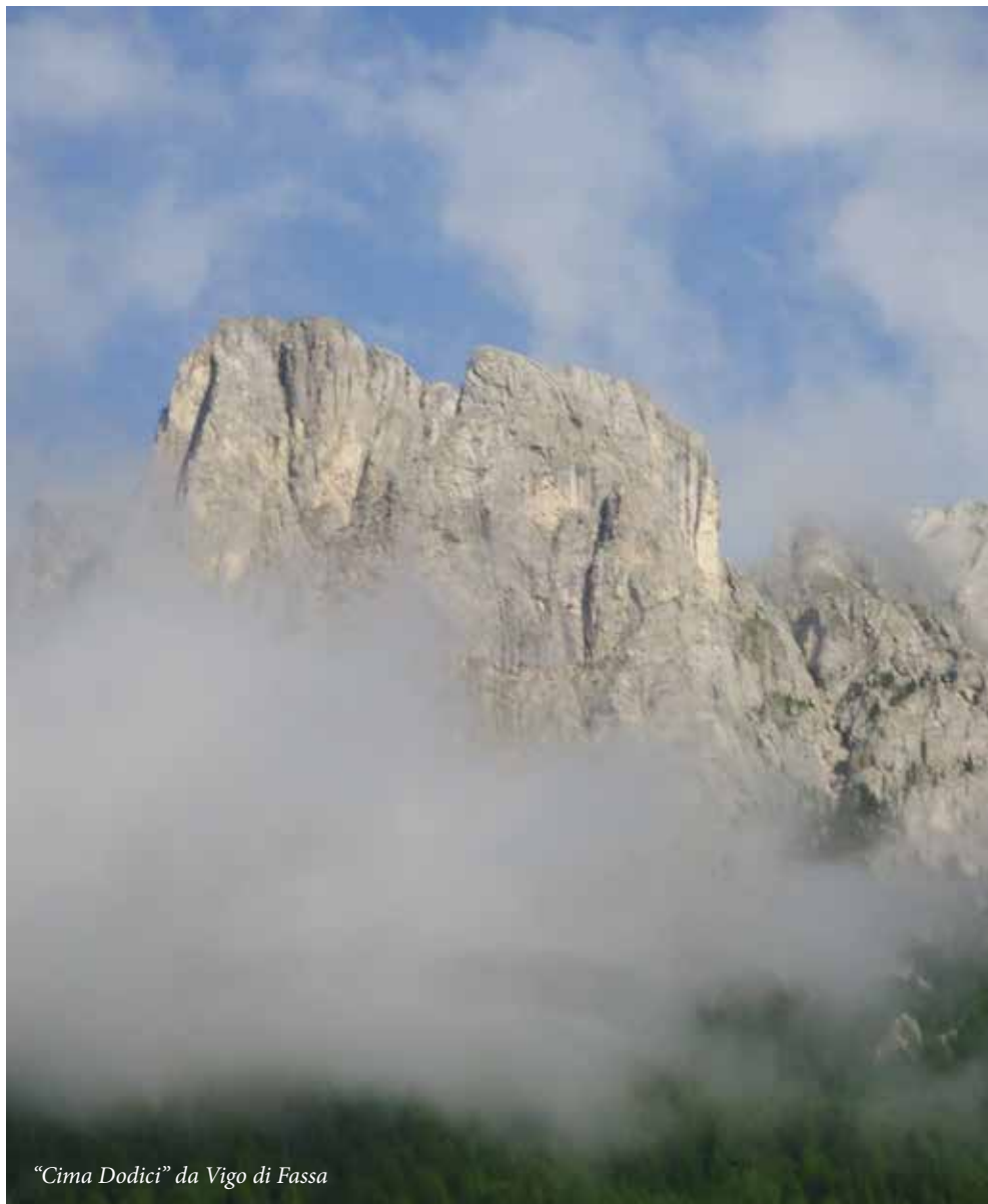
“Cima Dodici” da Vigo di Fassa

Il volume (144 pagine, più 2 dvd) ripercorre anno dopo anno la storia della kermesse cresciuta nel tempo fino a diventare un contenitore della cultura alpina in senso lato che coniuga tradizione e innovazione, e permette di rinnovare il ricordo di tanti illustri personaggi ospiti a Faenza.