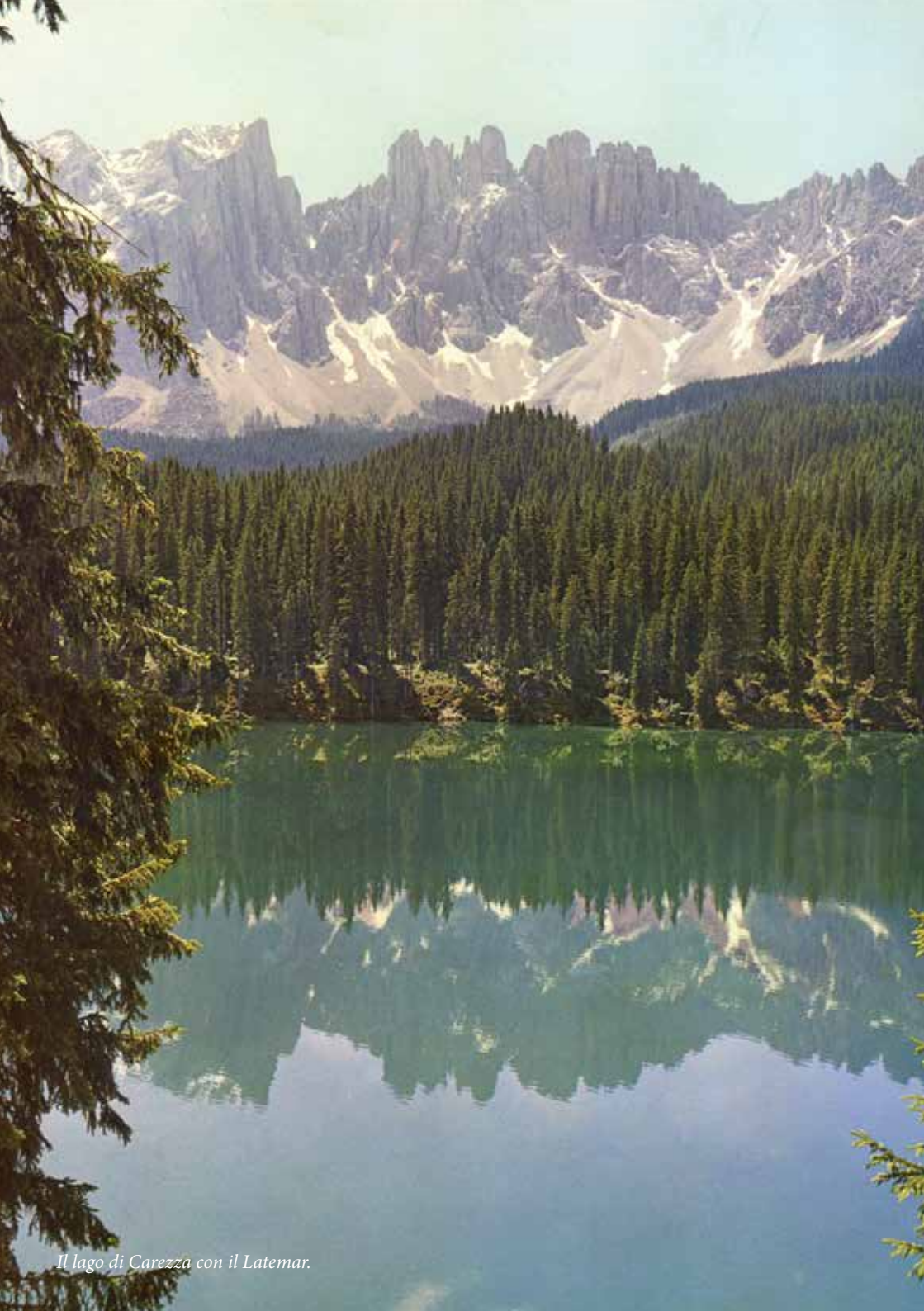
Il lago di Carezza con il Latemar.