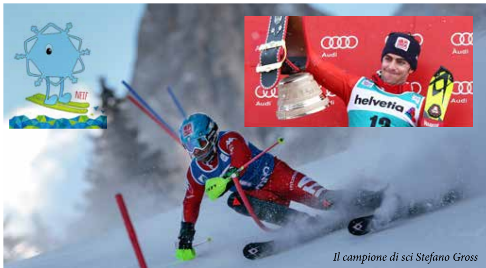
Il campione di sci Stefano Gross