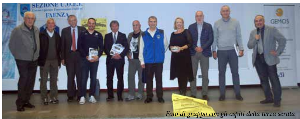
Foto di gruppo con gli ospiti della terza serata